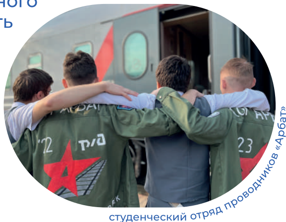
студенческий отряд проводников «Арбат»

Так, силами бойцов отрядов Удмуртии в 2025 году к 1 сентября была собрана сумма в размере более 500 тысяч рублей. Лидером Дня ударного труда этого года стал студенческий отряд проводников «Арбат». А рекордная среди бойцов сумма, переведенная в Фонд РСО - 10 000 рублей*.